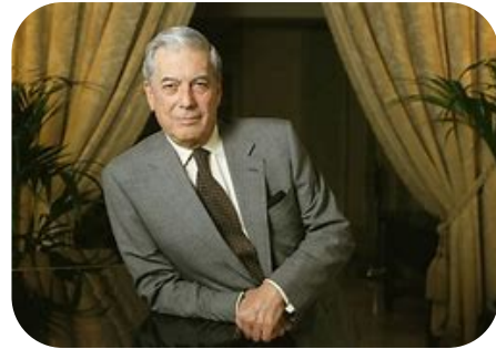
Mario Vargas Llosa